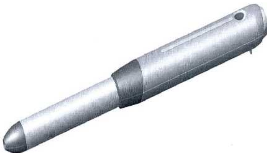
Figura 1: Vista en perspectiva

La novedad del modelo, al igual que su innovador diseño, puede ser apreciado a partir de las figuras que se anexa a este escrito, a saber: