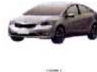
Fig. 2 es una vista frontal del mismo;

Fig. 1 es una vista en perspectiva de todo el automóvil mostrando nuestro diseño;