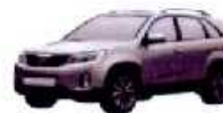
Fig. 1 es una vista en perspectiva de todo el automóvil mostrando nuestro diseño;

El presente modelo industrial se refiere a un diseño novedoso, original y ornamental para un automóvil cuyas especificaciones son las siguiente, haciendo referencia a los dibujos adjuntos que forman parte del mismo.