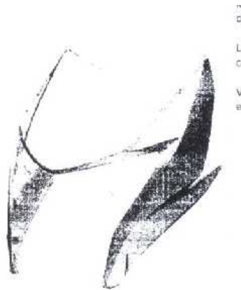
Figura 3 es una vista en perspectiva desde el lado posterior de la

Figura 2 es una vista en perspectiva desde el lado trasero de la misma;