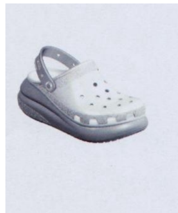
FIG. 1 es una vista frontal en perspectiva de CALZADO;

El presente diseño incluye un zapato con características que lo hacen nuevo y original. El presente diseño incluye una construcción en forma de zueco que incluye una parte superior, una tira del talón conectada a la parte superior y una suela. La suela se caracteriza por una parte del talón más alta y una parte más corta de la puntera. La suela incluye una ranura alrededor de la parte posterior de la suela hasta la zona media a cada lado de la suela entre la parte del talón y la puntera. La parte inferior de la parte del talón incluye elevaciones. La parte superior se caracteriza por agujeros redondeados en las partes delantera y media de la parte superior, y elevaciones en los bordes. La parte superior también incluye agujeros trapezoidales donde la parte superior se une a la suela. La tira del talón se caracteriza por un hueco alargado y agujeros redondos