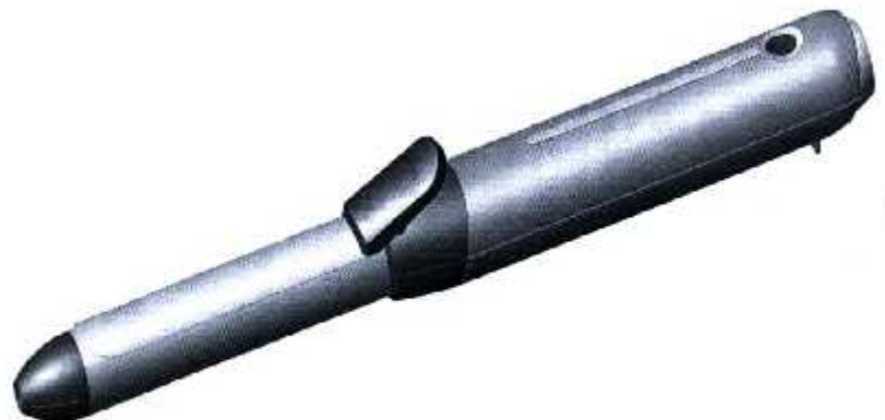
Figura 5: Vista lateral izquierda